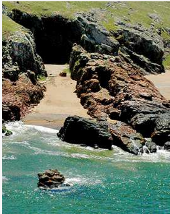
Las Grutas en la actualidad

Así y todo, las piscinas de las grutas se abrieron el 24 de diciembre del 68 con la presencia del presidente uruguayo Pacheco Areco y algunos embajadores. Entre los funcionarios