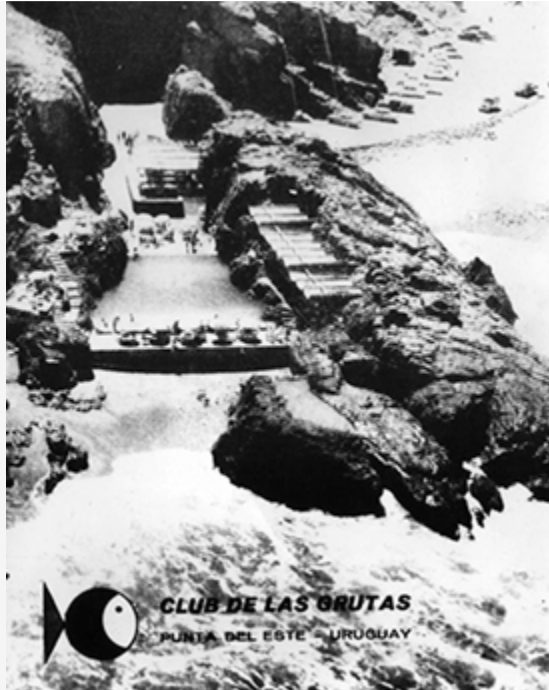
Las Grutas en los sesenta, con las piscinas funcionando

Una obra ambiciosa que debió luchar contra los infortunios: un mes antes de ser inaugurada, una tormenta se llevó todo el camino que había sido construido con sólo un camión y un compresor.