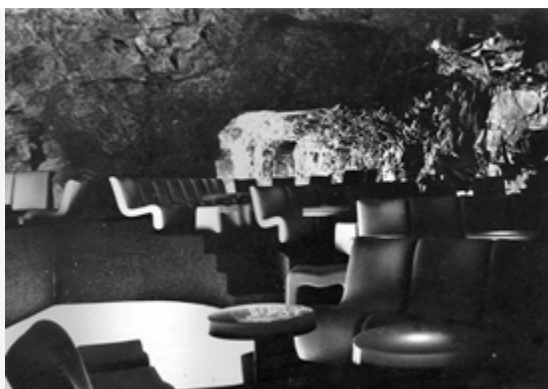
Interior de la boite de las Grutas

extranjeros, estaban los franceses que enseguida quisieron replicar la obra en sus costas. Por eso invitaron a Flores a Francia, donde estudió con el discípulo de Le Corbusier, Candilis.